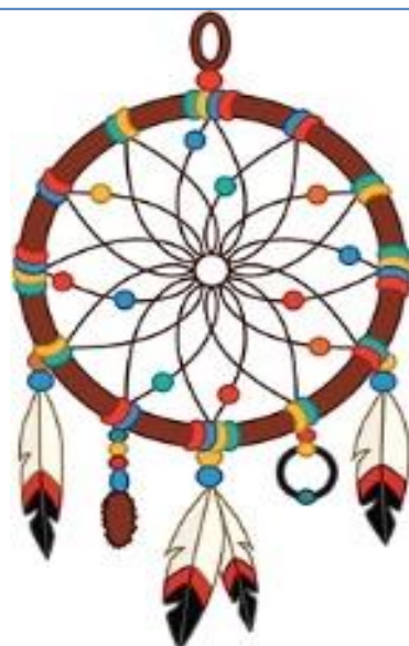
CHASSEUR DE RÊVES